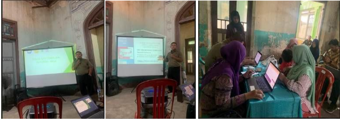
Gambar 2. Sesi Edukasi NIB